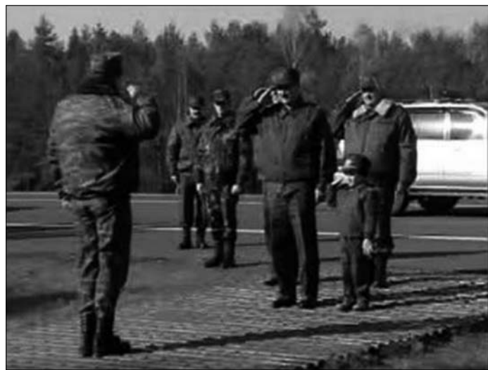
Вайсковая параноя. Генэрал рапартуе перад пазаілюбным дзіцёнкам Лукашэнка.

Цемра фармуе грамадзтва па свайму вобразу і падабенству, дзе нормай становіцца зьдзек і таптаньне годнасьці чалавека; мерай такіх дачыненняў робіцца сьмерць. Ня кожны чалавек можа стрываць прыніжэньне асобы, ганьбаваньне гонару і несправядлівасьць цемры. І чэрнь адчувае гэта, у яе ўзьнікае азарт перасьледу і дабіваньня; дрэнь пачынае ўяўляць сябе моцнай, робіцца вынаходлівай, пакуль не растопча альбо не загоніць душу ў магілу.