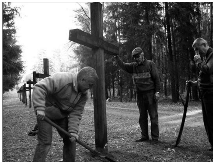
Сябры КХП – БНФ аднаўляюць крыжы ў Курапатах пасля найсьцяя вандалаў. 2008 г.