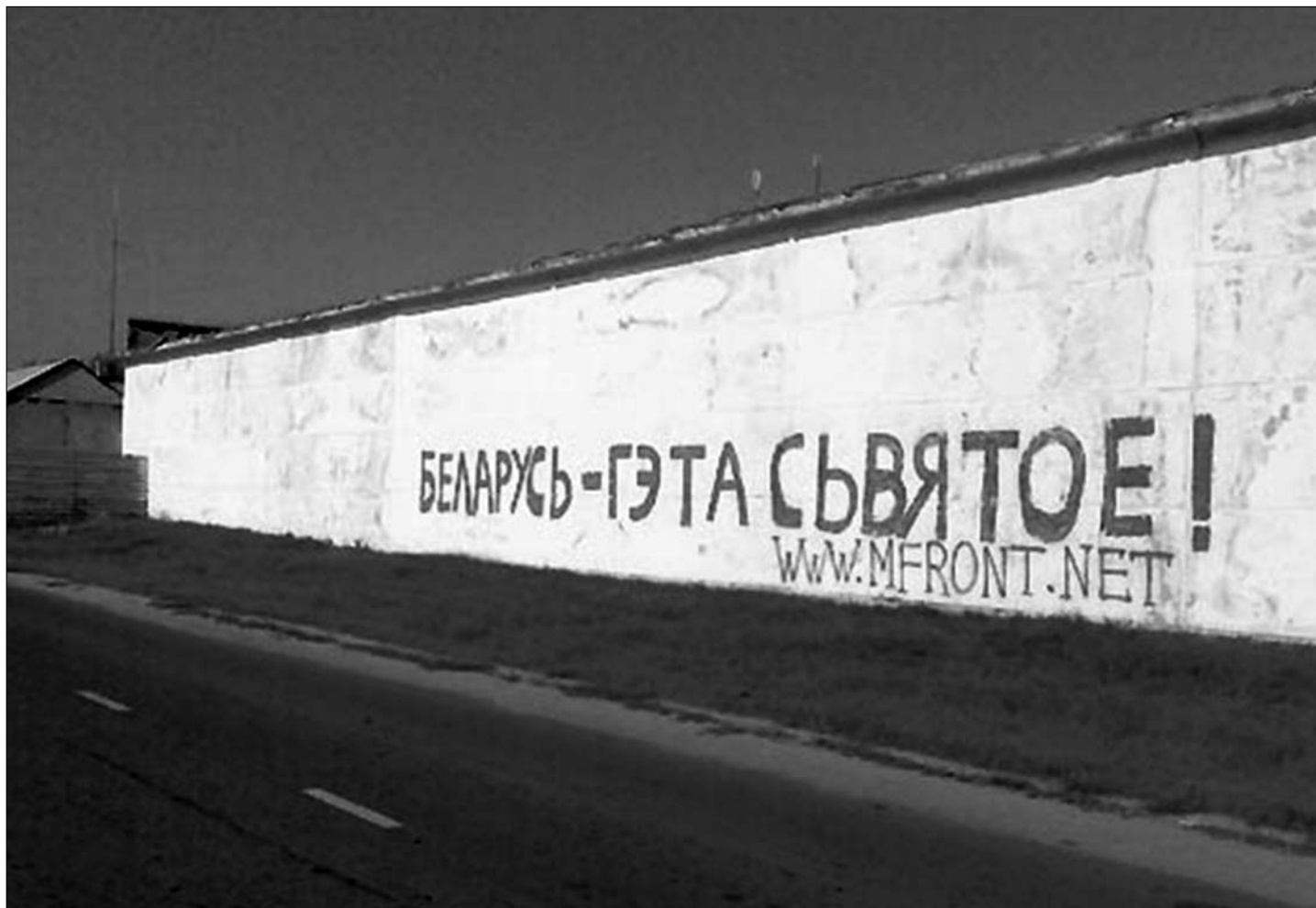
4. Надпіс на белай сьцяне.

Вітаю. Сусьветнай практыкай зьяўляецца стварэньне пры партыях моладзевых арганізацыяў. Падчас працы ў якіх маладыя людзі набіраюцца вопыту ў камунікацыях з іншымі групамі, арганізатарскага вопыту і г.д. Натуральна, што моладзі лягчэй асвоіцца ў сваім