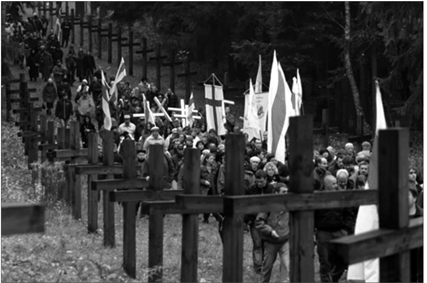
3. Крыжовае ішсьце. Народны Мэмарыял Курапаты.