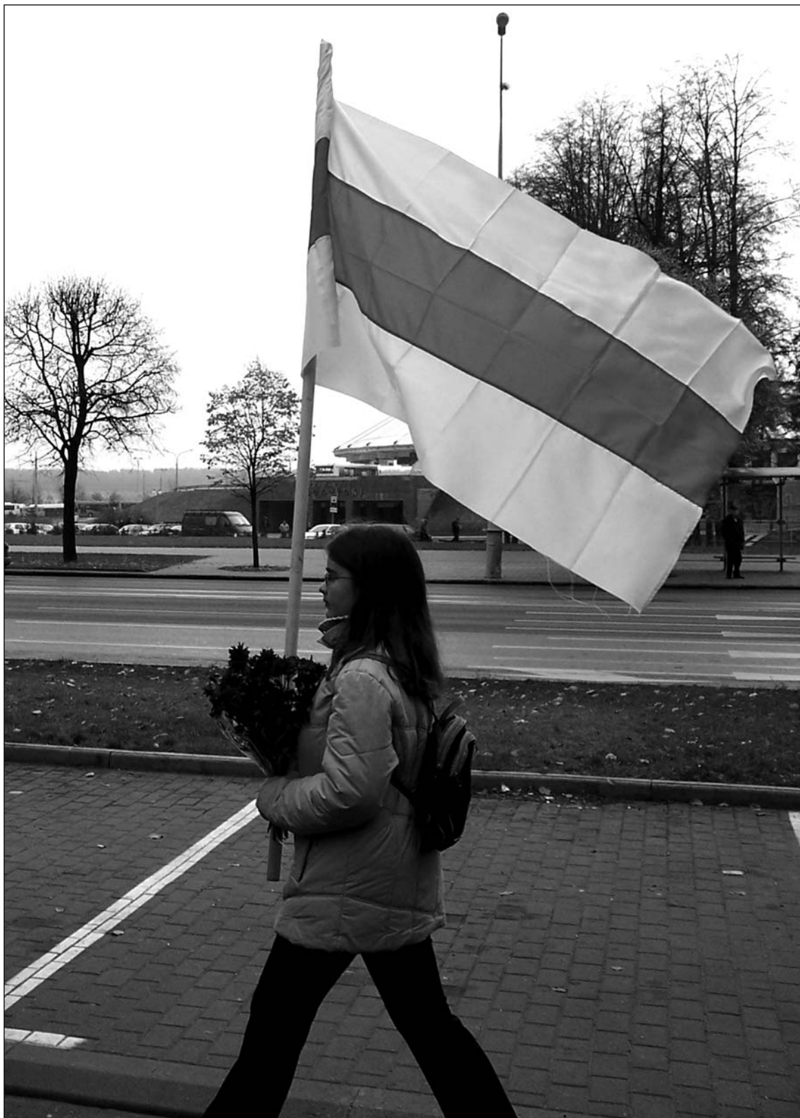
1. Нішто ня стыніць Беларусі.

НЬЮ-ЁРК – ВАРШАВА, верасень-сьнежань 2007 г.