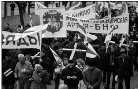
9. Крыжовае шэсьце на Курапаты.