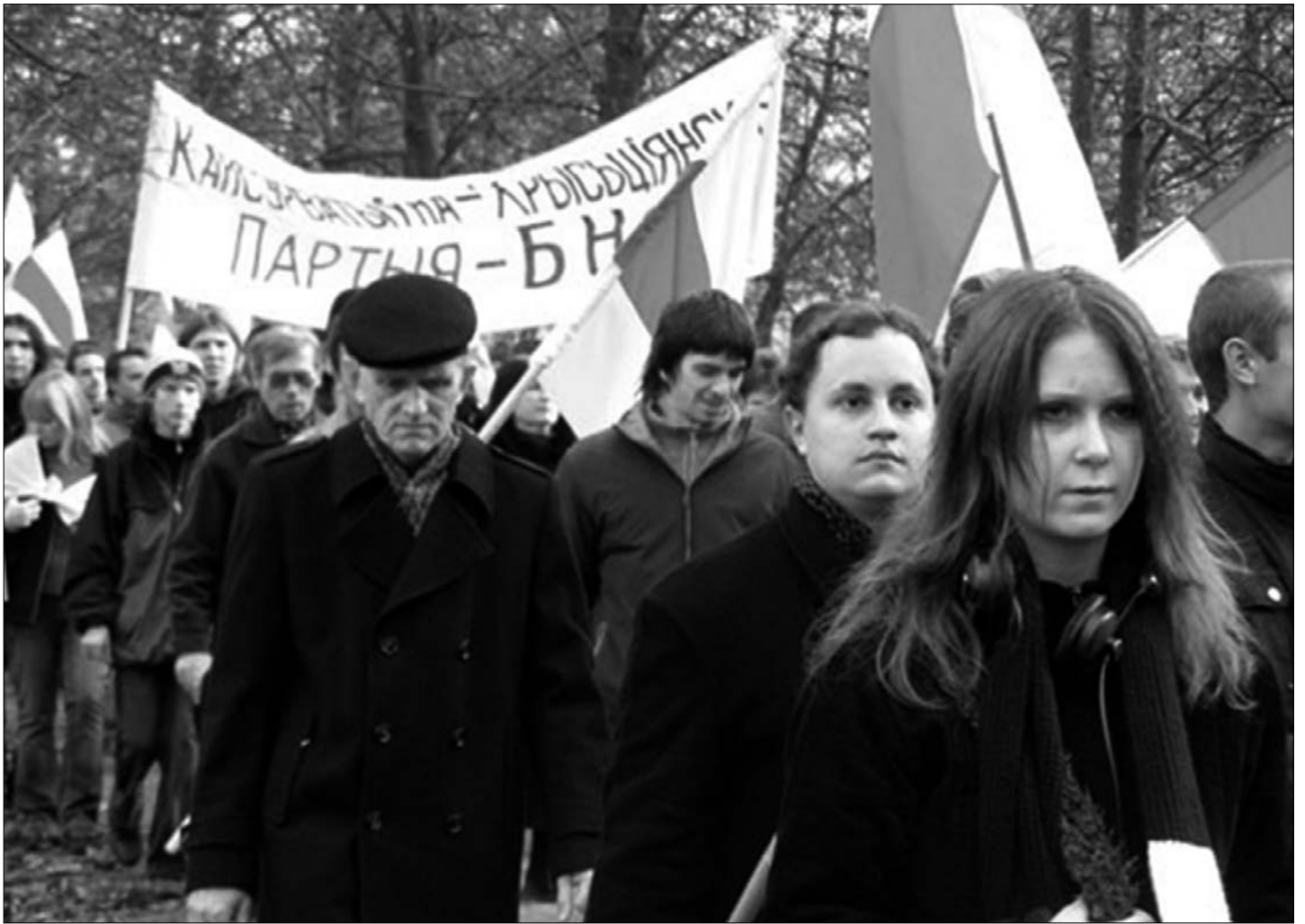
2. Дзяды-2007. Хаджэньне на Курапаты.

зьяця Мэмарыялу ўжо вызначылася, але кожны беларус, кожная сям'я можа паставіць тут свой крыж.