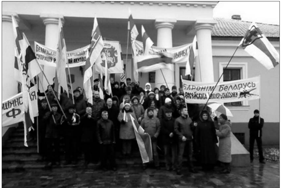
7. Група сяброў Кансэрватыўна-Хрысьціянскай Партыі – БНФ у Слуцку 25 лістапада 2007 г.

Арганізоўваючы свой „празднік”, рэжым нібыта прыгадаў гісторыю Менску. Але бітва на Нямізе і зьнішчэньне горада адбыліся ў сакавіку 1067 г., у люты холад. Раней антыбеларускі рэжым, каб выкрэсьціць з памяці народу Дзень Беларускай вайсковай славы 8 верасня, трубіў паўсюль, што 8 верасня трэба сьвяткаваць дзень пачатку ў 1941 годзе блакады Ленінграда. Прыцягненая за вушы чужая дата не прыжылася. Тады ненавісьнікі Беларусі вырашылі прыцягнуць за вушы эпізод з сакавіцкай трагедыяй 1067 года. На працягу двух дзён ракой лілася разліўная гарэлка і каньяк, на эстрадах сьпявалі расейскую папсу і танцавалі, дзіка тупаючы нагамі. Пускалі ў неба фаервэркі. Постсавецкая публіка „отдыхала і праздновала”. Што ж сьвяткаваў рэжым унутранай акупацыі? Рэжым арганізаваў буйнамаштабную п'янку і сатанінскія скокі, „празднуня” угодкі разбурэньня нашага роднага горада і масавага забойства гараджанаў – нашых дзядоў.