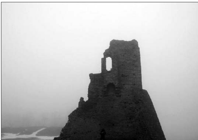
8. Вакно гісторыі.

На мітынгх выступалі намеснікі старшыні Фронту і Партыі Юрый Беленькі, Сяргей Папкоў, адказны сакратар Управы Фронту і Партыі Алесь Чахольскі. Была выказана ўдзячнасьць жыхарам вёсак Грозаў і Семежава за захаваньне і дагляд за крыжамі, якія ўсталяваныя ў памяць Слуцкіх Герояў. У прамовах выступаўцаў была адзначана, што для сучасных беларусаў, дарослых і моладзі, Слуцкі Збройны Чын зьяўляецца прыкладам змаганьня супраць расейскага імперскага акупанта. Гэта вельмі актуальна ў цяперашні час, калі гэбоўска-пуцінскай імперскай хэўра вядзе эканамічную, сацыяльную і інфармацыйную вайну супраць нашай краіны. У Расеі мільёнамі вымірае няшчасны народ, жыруе толькі лубянская і алігархічная эліта. Там ужо няма каму пампаваць газ і нафту, працаваць на Поўначы і ў Сібіры, служыць ў іх варварскай арміі. Вось туды, за тысячы кілёмэтраў ад роднага дому, яны й зьбіраюцца накіраваць беларусаў, нашых работнікаў, інжынэраў, нашу моладзь. Змагарныя Случакі дакладна сьведчаць, што галоўны вораг беларусаў